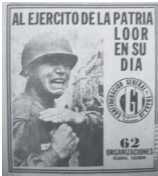
Solicitada de la CGT 62 Organizaciones. 29-05-75.