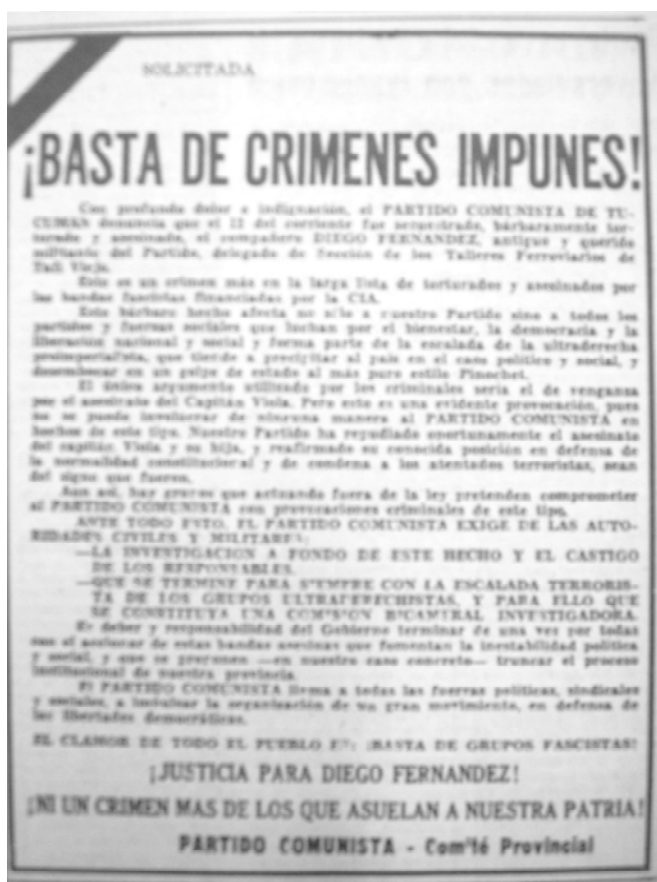
Solicitada del PC denunciando el crimen de uno de sus militantes. 29-05-75.

(25,4 %). Existe una menor cantidad de declaraciones y actos dirigidos a manifestar apoyo a Vilas (2,7 %), específicamente a fines de 1975 cuando se anuncia que será reemplazado por Bussi. Son sólo 6 (el 2 %) las acciones que refieren a la desaparición de personas. Esto nos habla de la situación que atravesaban quienes pretendían cuestionar o denunciar las acciones represivas. La posibilidad de acceder a un espacio de difusión en la prensa era extremadamente difícil y muy poca la información que se tenía sobre las personas secuestradas