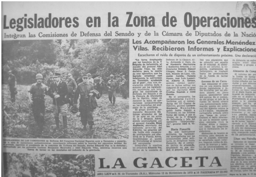
Legisladores integrantes de la Comisión de defensa recorriendo la zona de operaciones antisubversivas. 12-11-75.

Unos días antes, decenas de periodistas de todo el país recorrieron la zona donde el ejército estaba emplazado. El diario La Gaceta extractó las crónicas sobre dicha visita, que aparecieron en los principales diarios nacionales. El diario La Nación sostuvo que "en Tucumán no hay guerra. Es una lucha frontal contra la delincuencia subversiva. ¿Unos días más? ¿Unas semanas más? ¿Unos meses más? Es la batalla de la libertad en la que estamos todos. El terreno lo eligió la guerrilla, el momento también. La V Brigada de Infantería fue imponiendo cuotas de confianza. La bandera o las banderas de o los grupos subversivos -los mismos colores que desfilaron por las calles de Bs. As. cuando el Dr. Cámpora asumió la presidencia de la República- fue prontamente reemplazada en el mástil de la placita del pueblo por la única nacional conocida, respetada y honrada. Hasta que la seguridad no haya alejado definitivamente el temor, el ejército permanecerá en Tucumán en Operaciones. Operaciones que se ejecutan por orden del Poder político e institucional" (02/11/1975).