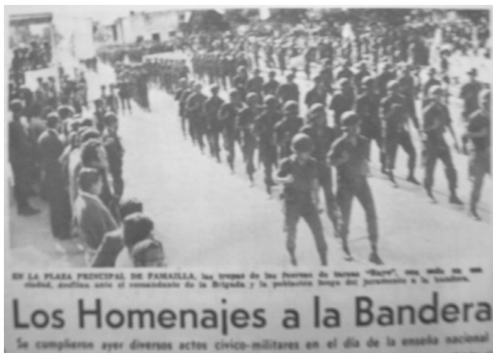
Desfile militar en el día de la bandera. Plaza principal de Famajila. 21-06-75.