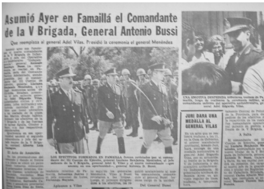
Nota sobre la asunción de Bussi al mando de la V Brigada. En un recuadro: "Juri dará una medalla al general Vilas." 16-12-75.

Desde el Ministerio de Bienestar Social -administrado por el jefe de la Triple A, José López Rega- se mandaban a la provincia cuantiosas mercaderías para ser repartidas entre la población y lograr así el apoyo popular. Siempre cuidando de vincular claramente la asistencia social con el Operativo Independencia y con el gobierno justicialista (tanto nacional y provincial). Sin embargo, en febrero de 1975 cuando la provincia recibió 50 millones de pesos con fines sociales, Vilas rápidamente trató de monopolizar estas tareas en manos de la V Brigada: "al Ministerio se le hacían conocer las necesidades y, de acuerdo a éstas, la V Brigada y no Bienestar Social, repartía los alimentos, útiles escolares, frazadas y otros artículos en la zona de operaciones." Y más adelante señala que "sabiendo que la imagen del Ejército y el éxito de las armas nacionales estaba de por medio, en ningún momento y bajo ningún aspecto permití que la propaganda política del peronismo aprovechara la pobreza tucumana para ganar votos o especular con los bienes que se entregaban en forma gratuita". ¡De hecho esa tarea la realizó el ejército en beneficio de su plan de exterminio!