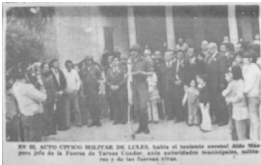
Acto cívico-militar en Lules. 26-05-75